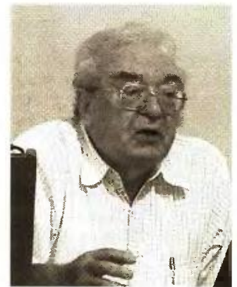
Ο καθηγητής έκανε καταγγελία στη διοίκηση του νοσοκομείου ενώ θέτει στη διάθεση των εισαγγελικών αρχών όλα τα σχετικά στοιχεία