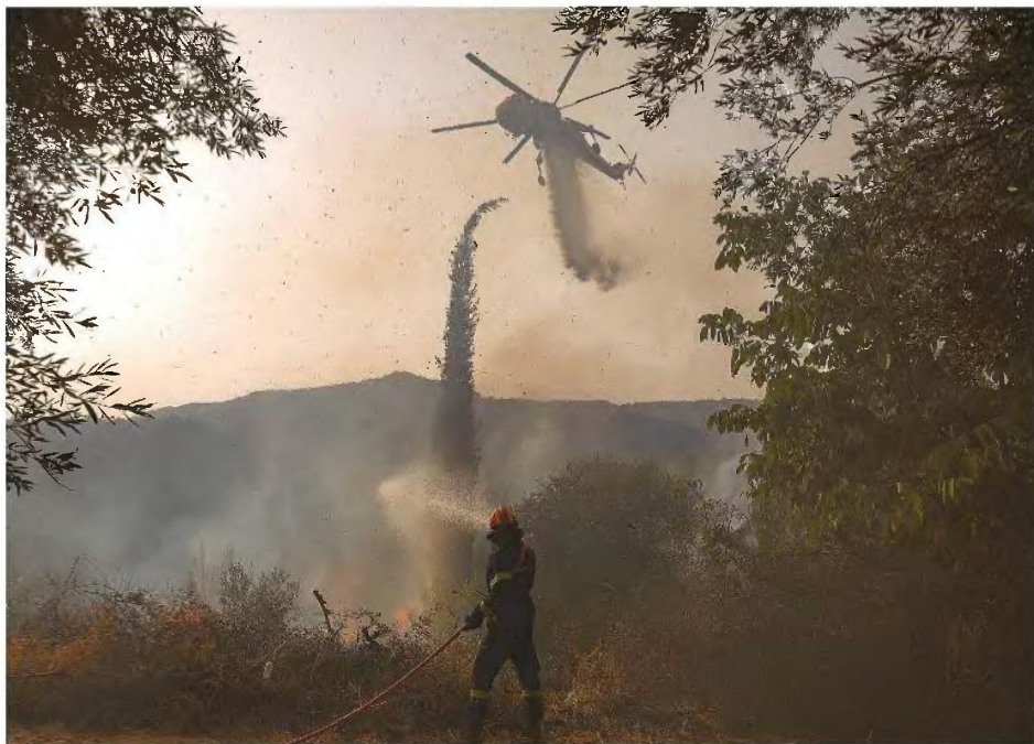
Σύμφωνα με ανακοίνωση της Πυροσβεστικής, στις δυνάμεις που είχαν αναπτυχθεί χθες στις δασικές πυρκαγιές της αρχαίας Ολυμπίας στην Ηλεία και της Γορτυνίας στην Αρκαδία περιλαμβάνονταν περισσότεροι από 570 πυροσβέστες με 30 ομάδες πεζοπόρων τμημάτων, 181 οχήματα, ενώ συμμετείχαν στην κατάσταση και αποστολές από τη Γαλλία, τη Βρετανία και τη Γερμανία.