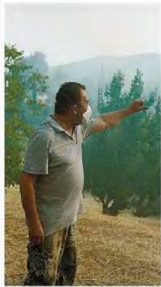
Οι ντόπιοι στην Εύβοια πλέον εστιάζουν στην επόμενη ημέρα και στον κίνδυνο πλημμυρών μετά τις καταστροφικές πυρκαγιές.

Η κατεστραμμένη έκταση στην Εύβοια πάνω από 500.000 στρέμματα, σύμφωνα με την καταγραφή ευρωπαϊκού δορυφωτικού συστήματος,