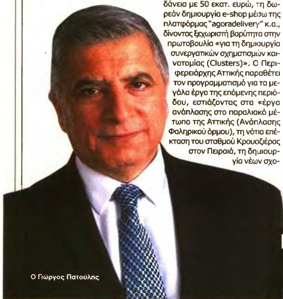
Ο Γιώργος Πατούλης

σκεψης στο Σπίτι οι οποίες έχουν στελεχωθεί με ιατρούς εξειδικευμένους και νοσηλευτές για εξέταση και λήψη δειγμάτων ρινοφαρυγγικών με την τεχνική PCR, καθώς και στην ηλεκτρονική πλατφόρμα 1110, στην οποία οι πολίτες μπορούν να απευθύνονται δωρεάν σε 24ωρη βάση. Επιπρόσθετα ενισχύσαμε τη Δημόσια Υγεία με πόρους και εξοπλισμό, δίνοντας δεκάδες εκατομμύρια ευρώ. Παράλληλα ενισχύσαμε τις μονάδες και φορείς υγείας του υπουργείου Υγείας με επικουρικό προσωπικό για την ανταπόκριση στις ανάγκες της επιδημίας Covid-19, προϋπολογισμού 110 εκ. και χρηματοδοτήσαμε τον Εθνικό Οργανισμό Δημόσιας Υγείας (ΕΟΔΥ) με το ποσό των 9,5 εκ. για την προμήθεια βιοϊατρικού και λοιπού εξοπλισμού για την αναβάθμιση αλλά και την ανάπτυξη νέων μονάδων εργαστηρίων ΚΕΔΥ. Θα συνεχίσουμε