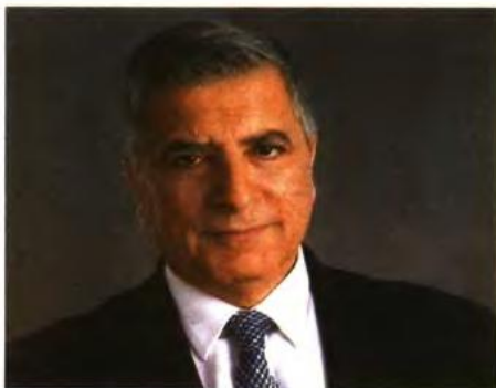
>ΤΟΥ ΓΙΩΡΓΟΥ ΠΑΤΟΥΛΑΝΗ ΠΕΡΙΦΕΡΕΙΑΡΧΗ ΑΤΤΙΚΗΣ - ΠΡΟΕΔΡΟΥ ΙΑΤΡΙΚΟΥ ΣΥΛΛΟΓΟΥ ΑΘΗΝΩΝ

Η πρωτοφανής κρίση λόγω της πανδημίας ανέδειξε την ουσιαστική συνεισφορά των Περιφερειών στη διαχείριση των σχετικών υγειονομικών και οικονομικών συνεπειών και επανέφερε την ανάγκη ενίσχυσης του ρόλου τους στον εθνικό σχεδιασμό για τη στήριξη της Δημόσιας Υγείας.